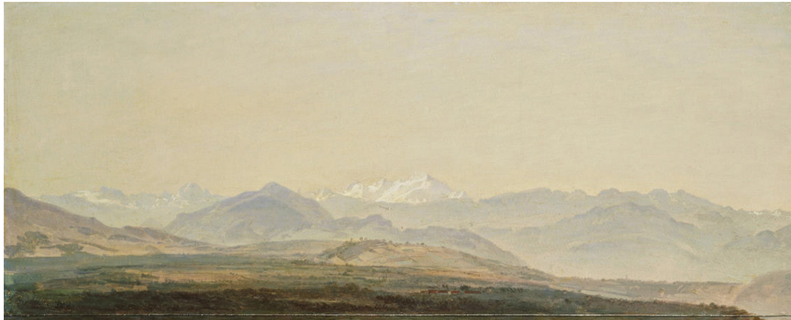
Fig 01. Wolfgang Adam Töpffer La chaîne du Mont-Blanc , 1816.

Sous la plume de Jean-Jacques Rousseau, notamment, la montagne devient peu à peu un objet de conquête et d'appropriation. Le panorama de Töpffer est issu de ce rapport au monde: la chaîne du Mont-Blanc s'offre en spectacle à l'observateur placé en position dominante, lui permettant d'embrasser une vaste étendue.